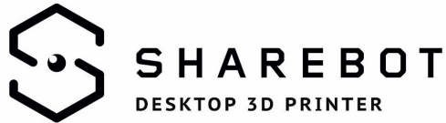
foto) fornendo inoltre assistenza e consulenza a tutti quei professionisti che desiderano sfruttare la tecnologia di stampa 3D per i propri modelli.